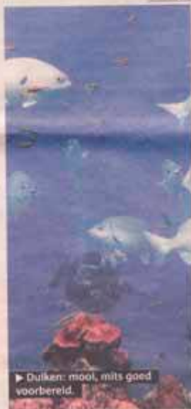
► Duiken: mooi, mits goed voorbereid.